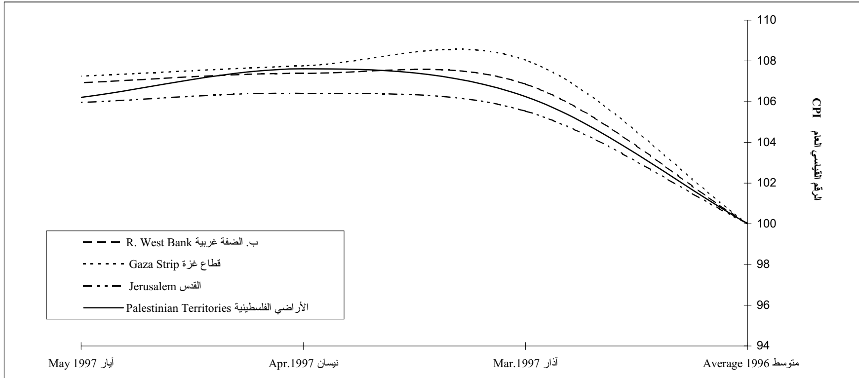
شكل 1: الارقام القياسية للأسعار، للأشهر: آذار - أيار 1997 Figure 1: Consumer Price Index for Mar - May.1997