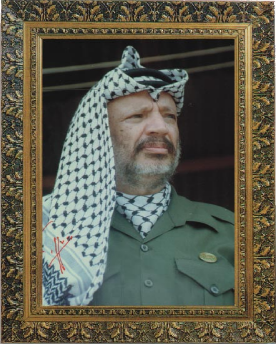
فخامة الرئيس ياسر عرفات رئيس اللجنة التنفيذية لمنظمة التحرير الفلسطينية رئيس السلطة الوطنية الفلسطينية رئيس اللجنة العليا للتعداد