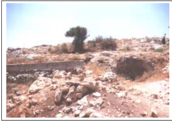
الصورة 1: خربة الكاره في تجمع عرب الرماضين الشمالي

يعتبر هذا التجمع ريفاً وذلك حسب تصنيف نوع التجمع المعتمد في الجهاز المركزي للإحصاء الفلسطيني. يقع تجمع عَرَب الرَمَاضِين الشَّمَالِي شرق مدينة قَلْقِيلِيَّة، على خط إحداثي محلي شمالي 177.80 م، وخط إحداثي محلي شرقي 150.35 م، ويرتفع عن سطح البحر 110 م، ويبعد عن مدينة قَلْقِيلِيَّة 3 كم، وتحيط به أراضي جَبُوس وقَلْقِيلِيَّة. ويبلغ عدد سكان التجمع حسب تعداد السكان والمساكن والمنشآت - 1997، 51 فرداً منهم 25 ذكراً و26 أنثى، ويبلغ عدد الأسر 8 أسر. كما يبلغ عدد المباني 14 مبنى وعدد الوحدات السكنية 8 وحدات. ويوجد في تجمع عَرَب الرَمَاضِين الشَّمَالِي موقعان أثريان مؤهلان للسياحة ولا يرتادهما السياح هما عزبة نوفل وخربة الكاره.