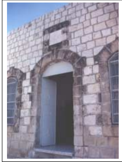
الصورة 3: السرايا في مدينة قلقيلية

والتجزئة، وإصلاح المركبات ذات المحركات والدراجات و يبلغ عددها 842 منشأة ويعمل فيها 1306 عاملاً، المطاعم و يبلغ عددها 48 منشأة ويعمل فيها 97 عاملاً، النقل والتخزين والاتصالات و يبلغ عددها 7 منشآت ويعمل فيها 32 عاملاً، الوساطة المالية و يبلغ عددها 33 منشأة ويعمل فيها 95 عاملاً، الأنشطة العقارية والإيجارية و يبلغ عددها 57 منشأة ويعمل فيها 97 عاملاً. كما يوجد فيها 111 مزرعة للحيوانات والطيور.