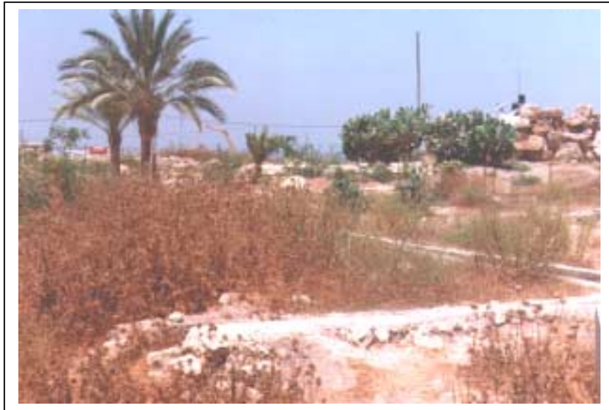
الصورة 4: خربة صوفين في مدينة قلقيلية