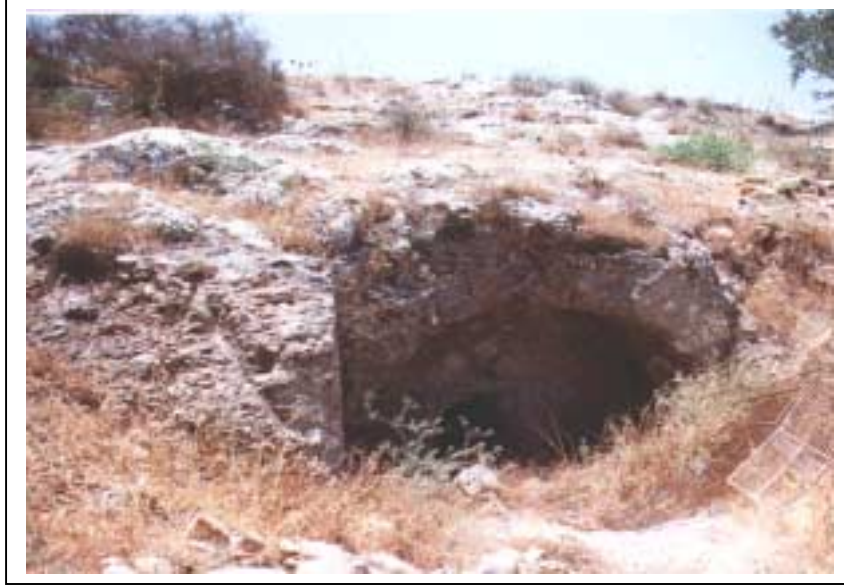
الصورة 5: خربة الكارة في مدينة قَلْقِيلِيَّة

ويتوفر في المدينة شبكة صرف صحي. كما يتوفر في قَلْقِيلِيَّة موقع للتخلص من النفايات يبعد عن أقرب منطقة سكنية حوالي 2.0 كم، وتستخدم سيارة خاصة بالنفايات لجمع نفايات المدينة حيث يتم جمعها يومياً، ويتم التخلص من النفايات عن طريق دفنها. ويتوفر في قَلْقِيلِيَّة شبكة هاتف تعمل من خلال مقسم آلي داخل المدينة، ويبلغ عدد خطوط الهاتف 3380 خطاً هاتفياً (حسب إحصائيات 1999).