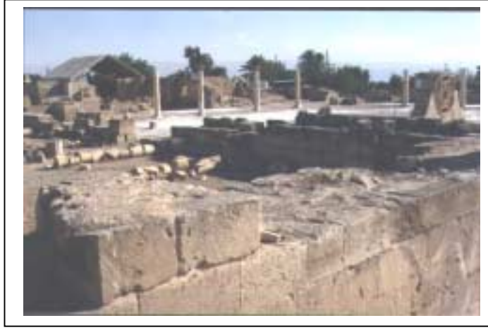
الصورة 3: قصر هشام في مدينة أريحا