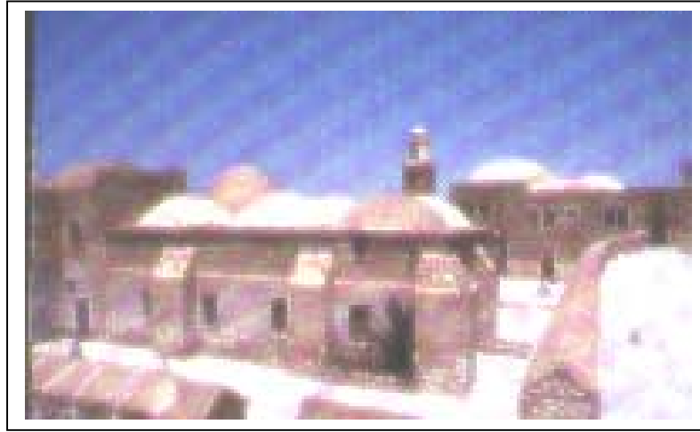
الصورة 5: النبي موسى

يعتبر هذا التجمع ريفاً وذلك حسب تصنيف نوع التجمع المعتمد في الجهاز المركزي للإحصاء الفلسطيني. يقع تجمع النبي موسى غرب مدينة أريحا، على خط إحداثي محلي شمالي 132.65 م، وخط إحداثي محلي شرقي 191.00 م، وينخفض عن مستوى سطح البحر 66 م، ويبعد عن مدينة أريحا 10 كم، وتحيط به أراضي أريحا. يبلغ عدد سكان التجمع حسب تعداد السكان والمساكن والمنشآت - 1997، 45 فرداً منهم 25 ذكراً و20 أنثى، ويبلغ عدد الأسر 7 أسر. كما يبلغ عدد المباني مبنى واحد فقط وعدد الوحدات السكنية وحدة سكنية واحدة فقط. ويوجد في تجمع النبي موسى موقع أثري واحد مؤهل للسياحة ويرتاده السياح وهو النبي موسى.