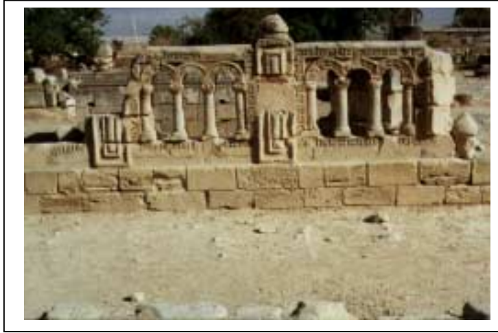
الصورة 4: قصر هشام في مدينة أريحا

تقع على أراضي مدينة أريحا مستعمرة (فيرد يريحو) والتي تبلغ مساحتها العمرانية 350 دونماً، وقد تم تأسيس هذه المستعمرة عام 1979، وتصنف هذه المستعمرة كمستعمرة زراعية.