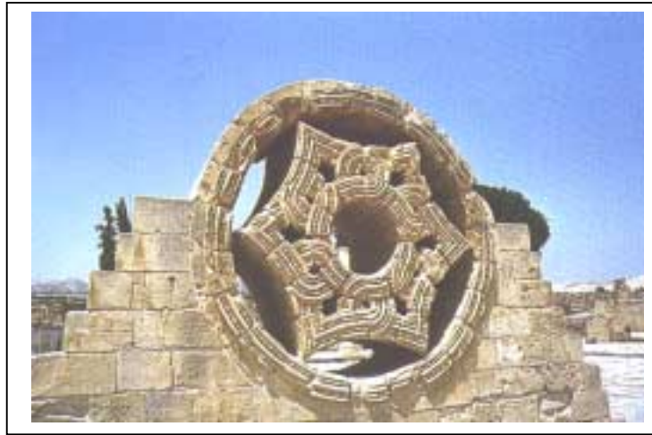
الصورة 2: قصر هشام في مدينة أريحا

ويعمل فيها 69 عاملاً، الأنشطة العقارية والإيجارية ويبلغ عددها 24 منشأة ويعمل فيها 57 عاملاً. كما يوجد فيها 14 مزرعة للحيوانات والطيور، وتتميز مدينة أريحا بوجود ينبوعين للماء فيها.