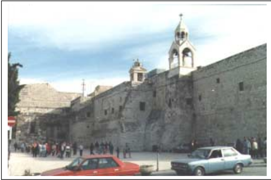
الصورة 1: كنيسة المهد في مدينة بيت لحم

يعتبر هذا التجمع حضراً وذلك حسب تصنيف نوع التجمع المعتمد في الجهاز المركزي للإحصاء الفلسطيني. تقع مدينة بيت لحم على خط إحداثي محلي شمالي 123.84 م، وخط إحداثي محلي شرقي 159.80 م، وترتفع عن سطح البحر 750 م، وتبلغ مساحتها الكلية 29799 دونماً، ومساحة المنطقة المبنية فيها 5171 دونماً، وتحيط بها أراضي صور باهر وبيت ساحور والشوآور. ويبلغ عدد سكان المدينة حسب تعداد السكان والمساكن والمنشآت - 1997، 21947 فرداً منهم 11187 ذكراً و10760 أنثى، ويبلغ عدد الأسر 4232 أسرة. كما يبلغ عدد المباني 2802 مبنى وعدد الوحدات السكنية 5335 وحدة. ويدير مدينة بيت لحم مجلس بلدي تم تكليفه عن طريق التعيين من قبل وزارة الحكم المحلي، ويتكون من 14 عضواً من الذكور وعضو واحد من الإناث. ويتوفر مقر للمجلس البلدي تبلغ مساحته 2400 م 2 . ويعمل في المجلس البلدي 167 موظفاً و8 موظفات. أما أهم الحاجات التطويرية للسلطة المحلية فهي زيادة الكادر الفني الموجود. ويوجد في تجمع بيت لحم 12 موقعاً أثرياً منها 8 مواقع مؤهلة للسياحة، ويرتادها السياح، وهي كنيسة المهد، ومغارة الحليب، وأبار النبي داود، ومتحف بيتنا التلحمي القديم، ومسجد عمر، وقوس الشاعر، وقوس الفواغرة، وحوش حنانيا، وهناك موقع واحد مؤهل للسياحة ولا يرتاده السياح وهو عين السبيل (ستنا مريم)، كما يوجد ثلاثة مواقع غير مؤهلة ولا يرتادها السياح وهي مخفر الشرطة القديم/المهد، وبر جقمان، وكنيسة يوسف.