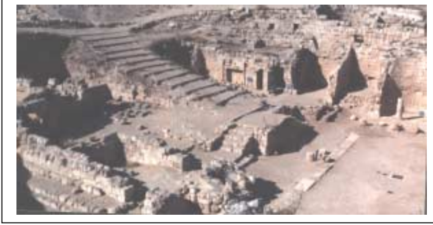
الصورة 6: الفريديس في تجمع الفريديس

يعتبر هذا التجمع ريفاً، وذلك حسب تصنيف نوع التجمع المعتمد في الجهاز المركزي للإحصاء الفلسطيني. يقع تجمع الفريديس جنوب شرق مدينة بيت لحم، على خط إحداثي محلي شمالي 119.67 م، وخط إحداثي محلي شرقي 172.70 م، ويرتفع عن سطح البحر 680 م، ويبعد عن مدينة بيت لحم 8 كم، وتحيط به أراضي بيت تَعَمَّر وزَعْتَرَة وجبّة الذيب والعقّاب والشوّاورة. يبلغ عدد سكان التجمع حسب تعداد السكان والمساكن والمنشآت - 1997، 525 فرداً منهم 265 ذكراً و260 أنثى، ويبلغ عدد الأسر 82 أسرة. كما يبلغ عدد المباني 75 مبنى وعدد الوحدات السكنية 101 وحدة. ويوجد في تجمع الفريديس موقع أثري واحد مؤهل للسياحة، ويرتاده السياح وهو الفريديس.