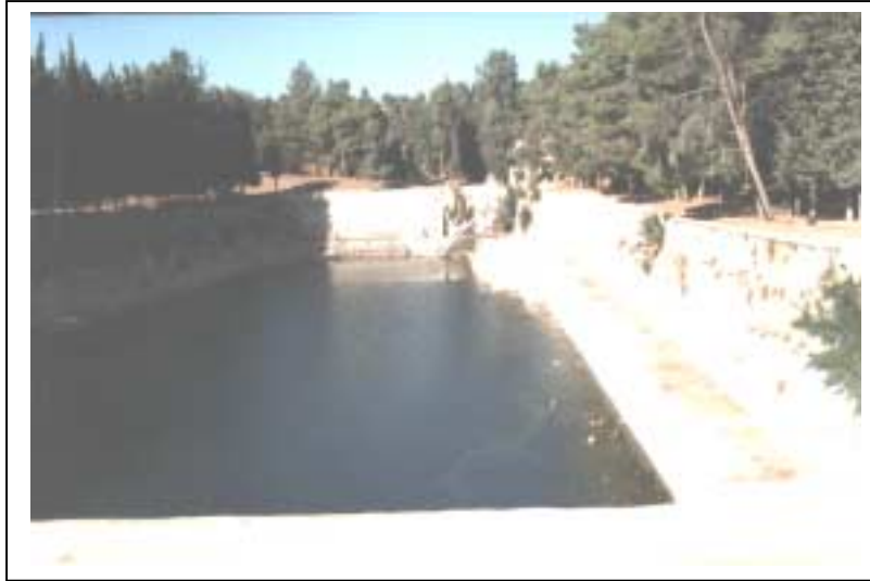
الصورة 4: برك سليمان في تجمع ارطاس

يعتبر هذا التجمع ريفاً وذلك حسب تصنيف نوع التجمع المعتمد في الجهاز المركزي للإحصاء الفلسطيني. يقع تجمع إرطاس غرب مدينة بيت لحم، على خط إحدائي محلي شمالي 121.85 م، وخط إحدائي محلي شرقي 167.82 م، ويرتفع عن سطح البحر 680 م، ويبعد عن مدينة بيت لحم 4 كم، وتبلغ مساحته الكلية 4304 دونمات، ومساحة المنطقة المبنية فيه 325 دونماً، وتحيط به أراضي بيت جالا ومدينة بيت لحم والخضير. ويبلغ عدد سكان التجمع حسب تعداد السكان والمساكن والمنشآت - 1997، 2686 فرداً منهم 1371 ذكراً و1315 أنثى، ويبلغ عدد الأسر 423 أسرة. كما يبلغ عدد المباني 347 مبنى، وعدد الوحدات السكنية 492 وحدة. ويدير تجمع إرطاس مجلس قروي تم تكليفه عن طريق التعيين من قبل وزارة الحكم المحلي، ويتكون من تسعة أعضاء ذكور. ويتوفر مقر للمجلس القروي تبلغ مساحته 16 م 2 . أما أهم الحاجات التطويرية للسلطة المحلية فهي توفير الأثاث للمجلس. ويوجد في تجمع إرطاس ثلاثة مواقع أثرية مؤهلة للسياحة ويرتادها السياح، وهي برك سليمان والقلعه ودير ارطاس.