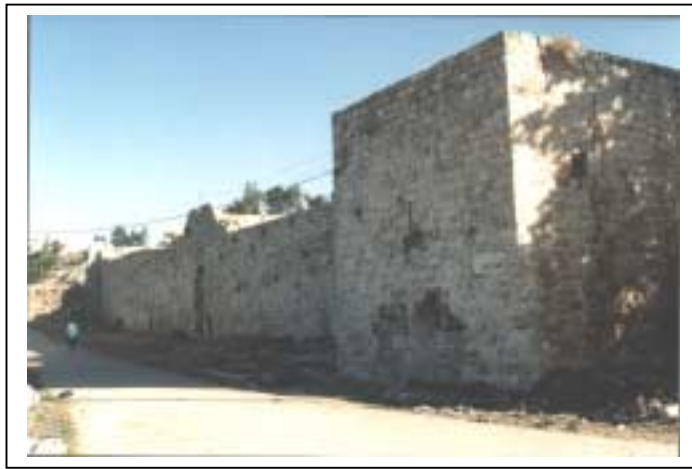
الصورة 5: القلعة في تجمع ارطاس

يتوفر في تجمع إرطاس شبكة مياه عامة، ويبلغ عدد المشتركين في خدمة المياه 250 مشتركاً في القطاع السكني. ويوجد في تجمع إرطاس شبكة كهرباء عامة، وتشكل شركة كهرباء محافظة القدس المصدر الرئيسي للكهرباء في التجمع. إلا أنه لا يتوفر فيه شبكة صرف صحي، وإنما يتم التخلص من المياه العادمة بواسطة الحفر الامتصاصية، ومن ثم يتم التخلص منها في أودية تبعد عن التجمع مسافة مقدارها 4 كم. ويوجد في إرطاس موقع يستعمل للتخلص من النفايات يبعد عن أقرب منطقة سكنية حوالي 1.5 كم، حيث يتم جمعها أكثر من مرة في الأسبوع. ويتم التخلص من نفايات التجمع عن طريق حرقها أو دفنها. ويتوفر في إرطاس شبكة هاتف تعمل من خلال مقسم آلي خارج التجمع، ويبلغ عدد خطوط الهاتف 50 خطاً هاتفياً (حسب إحصائيات 1999).