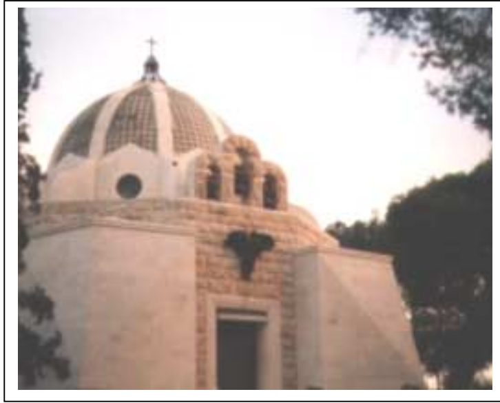
الصورة 3: حقل الرعاة في مدينة بيت ساحور

يعتبر هذا التجمع حضراً وذلك حسب تصنيف نوع التجمع المعتمد في الجهاز المركزي للإحصاء الفلسطيني. يقع تجمع بيت ساحور شرق مدينة بيت لحم، على خط إحدائي محلي شمالي 123.21 م، وخط إحدائي محلي شرقي 171.55 م، ويرتفع عن سطح البحر 650 م، ويبعد عن مدينة بيت لحم 1.5 كم، وتبلغ مساحته الكلية 6945 دونماً، ومساحة المنطقة المبنية فيه 1988 دونماً، وتحيط به أراضي صور باهر ودار صلاح ومدينة بيت لحم. ويبلغ عدد سكان التجمع حسب تعداد السكان والمسكن والمنشآت - 1997، 11285 فرداً منهم 5690 ذكراً و5595 أنثى، ويبلغ عدد الأسر 2319 أسرة. كما يبلغ عدد المباني 1823 مبنى وعدد الوحدات السكنية 2790 وحدة. ويدير تجمع بيت ساحور مجلس بلدي تم تكليفه عن طريق التعيين من قبل وزارة الحكم المحلي، ويتكون من خمسة أعضاء ذكور. ويتوفر مقر للمجلس البلدي تبلغ مساحته 60 م 2 . ويعمل في المجلس البلدي 30 موظفاً و5 موظفات. أما أهم الحاجات التطويرية للسلطة المحلية فهي توفير أجهزة حاسوب للمجلس. ويوجد في تجمع بيت ساحور موقعان أثريان مؤهلان للسياحة ويرتادهما السياح، هما حقل الرعاة، وحقل الرعاة للفرنسيسكان.