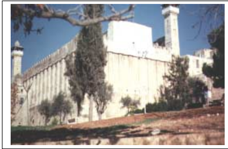
الصورة 5: الحرم الإبراهيمي في مدينة الخليل