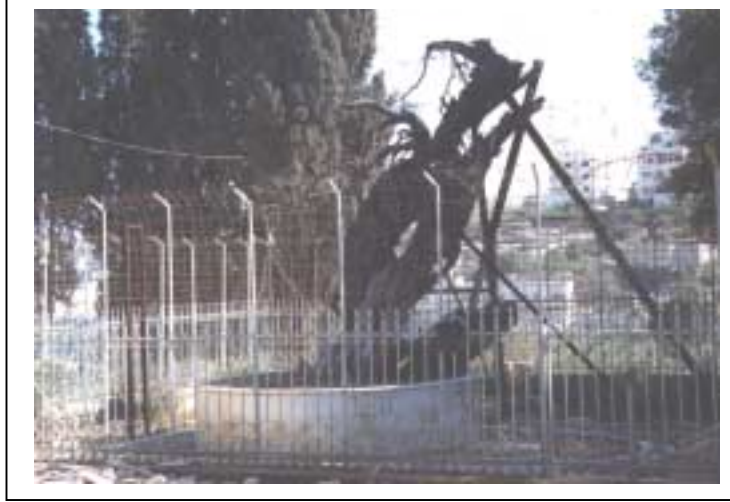
الصورة 4: بلوطة سيدنا إبراهيم في مدينة الخليل

5192 عاملاً، والإنشاءات ويبلغ عددها 37 منشأة ويعمل فيها 212 عاملاً، والفنادق والمطاعم ويبلغ عددها 153 منشأة ويعمل فيها 315 عاملاً، والنقل والتخزين والاتصالات ويبلغ عددها 41 منشأة ويعمل فيها 303 عمال، والوساطة المالية ويبلغ عددها 31 منشأة ويعمل فيها 227 عاملاً، والأنشطة العقارية والإيجارية ويبلغ عددها 220 منشأة ويعمل فيها 497 عاملاً. كما يوجد فيها 168 مزرعة للحيوانات والطيور. وتتميز الخليل بوجود 36 ينبوع ماء فيها.