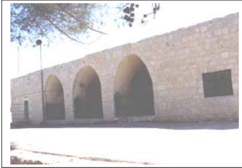
الصورة 7: مقام النبي نوح في تجمع دورا

يعتبر هذا التجمع حضراً وذلك حسب تصنيف نوع التجمع المعتمد في الجهاز المركزي للإحصاء الفلسطيني. يقع تجمع دُوراً غرب مدينة الخليل، على خط إحدائي محلي شمالي 101.66 م، وخط إحدائي محلي شرقي 153.00 م، ويرتفع عن سطح البحر 880 م، ويبعد عن مدينة الخليل 11 كم، وتبلغ مساحته الكلية 156600 دونم، ومساحة المنطقة المبنية فيه 2160 دونماً، وتحيط به أراضي تَفُوح ويطأ ومدينة الخليل والسَّمُوع والظَاهِرِيَّة. ويبلغ عدد سكان التجمع حسب تعداد السكان والمساكن والمنشآت - 1997، 15503 أفراد منهم 7899 ذكراً و7604 إناث، ويبلغ عدد الأسر 2342 أسرة. كما يبلغ عدد المباني 2468 مبنى وعدد الوحدات السكنية 2835 وحدة. ويدير تجمع دُوراً مجلس بلدي تم تكليفه عن طريق التعيين من قبل وزارة الحكم المحلي، ويتكون من 5 أعضاء جميعهم ذكور. ويتوفر مقر للمجلس البلدي تبلغ مساحته 660 م 2 . ويعمل في المجلس البلدي 70 موظفاً و3 موظفات. أما أهم الحاجات التطويرية للسلطة المحلية فهي تأهيل وتدريب الكادر. ويوجد في تجمع دُوراً موقعان أثريان، غير مؤهلين للسياحة ولا يرتادهما السياح، وهما العمري ومقام النبي نوح.