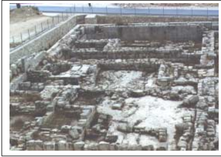
الصورة 3: بئر حرم الرامة في مدينة الخليل

يعتبر هذا التجمع حضراً وذلك حسب تصنيف نوع التجمع المعتمد في الجهاز المركزي للإحصاء الفلسطيني. تقع مدينة الخليل على خط إحداثي محلي شمالي 104.42 م، وخط إحداثي محلي شرقي 159.61 م، ويتراوح ارتفاعها عن سطح البحر بين 800 م و1020 م، وتبلغ مساحتها الكلية 74400 دونم، ومساحة المنطقة المبنية فيها 14950 دونماً، وتحيط بها أراضي حُلُول وسَعير وبني نعيم ويطاً ودُورا. ويبلغ عدد سكان المدينة حسب تعداد السكان والمساكن والمنشآت - 1997، 119401 فرداً منهم 62005 ذكور و57396 أنثى، ويبلغ عدد الأسر 18359 أسرة. كما يبلغ عدد المباني 14494 مبنى وعدد الوحدات السكنية 24059 وحدة. ويدير مدينة الخليل مجلس بلدي تم تكليفه عن طريق الانتخاب، ويتكون من 6 أعضاء جميعهم ذكور. ويتوفر مقر للمجلس البلدي تبلغ مساحته 2457 م 2 . ويعمل في المجلس البلدي 684 موظفاً و20 موظفة. أما أهم الحاجات التطويرية للسلطة المحلية فهي تأهيل وتدريب الكادر. ويوجد في مدينة الخليل 10 مواقع أثرية، 3 مواقع منها مؤهلة للسياحة ويرتادها السياح، وهي بئر حرم الرامة، وبلوطة سيدنا إبراهيم، والحرم الإبراهيمي، و7 مواقع غير مؤهلة للسياحة ولا يرتادها السياح، وهي خربة الحرايق، وتل ارماده، ونمر حمام ستنا سارة، وخربة كنعان، وخربة الضحاح، وخربة بلد النصارى، ومشهد الأربعين.