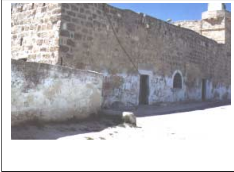
الصورة 6: مسجد النبي لوط في تجمع بني نعيم

يعتبر هذا التجمع حضراً وذلك حسب تصنيف نوع التجمع المعتمد في الجهاز المركزي للإحصاء الفلسطيني. يقع تجمع بني نعيم شرق مدينة الخليل، على خط إحداثي محلي شمالي 102.65 م، وخط إحداثي محلي شرقي 165.26 م، ويرتفع عن سطح البحر 950 م، ويبعد عن مدينة الخليل 6 كم، وتبلغ مساحته الكلية 71667 دونماً، ومساحة المنطقة المبنية فيه 2450 دونماً، وتحيط به أراضي سعيير ويطاً ومدينة الخليل. ويبلغ عدد سكان التجمع حسب تعداد السكان والمسكن والمنشآت - 1997، 13582 فرداً منهم 6799 ذكراً و6783 أنثى، ويبلغ عدد الأسر 1870 أسرة. كما يبلغ عدد المباني 2104 مبانٍ وعدد الوحدات السكنية 2205 وحدات. ويدير تجمع بني نعيم مجلس بلدي تم تكليفه عن طريق التعيين من قبل وزارة الحكم المحلي، ويتكون من 13 عضواً جميعهم ذكور. ويتوفر مقر للمجلس البلدي تبلغ مساحته 120 م 2 . ويعمل في المجلس البلدي 20 موظفاً. أما أهم الحاجات التطويرية للسلطة المحلية فهي تأهيل وتدريب الكادر. ويوجد في تجمع بني نعيم موقع أثري واحد، مؤهل للسياحة ويرتاده السياح، وهو مقام النبي ياقيت.