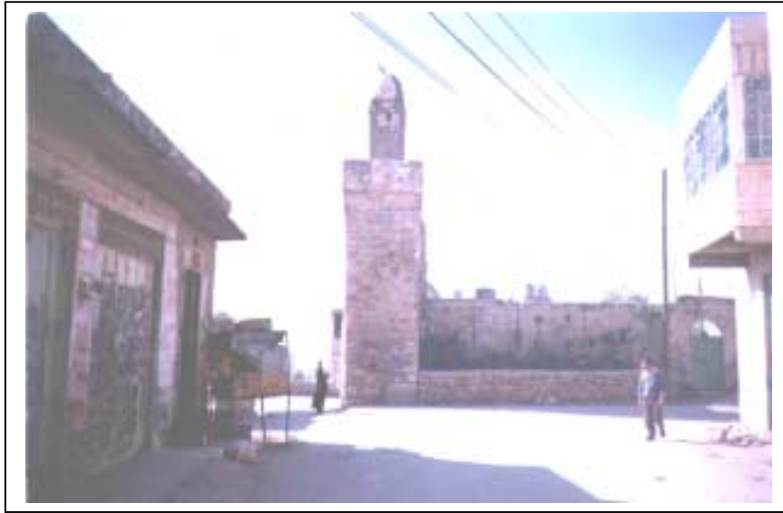
الصورة 1: النبي متى في تجمع بيت أمر

يعتبر هذا التجمع حضراً، وذلك حسب تصنيف نوع التجمع المعتمد في الجهاز المركزي للإحصاء الفلسطيني. يقع تجمع بيت أومر شمال مدينة الخليل، على خط إحدائي محلي شمالي 114.33 م، وخط إحدائي محلي شرقي 160.60 م، ويرتفع عن سطح البحر 950 م، ويبعد عن مدينة الخليل 8 كم، وتبلغ مساحته الكلية 30129 دونماً، ومساحة المنطقة المبنية فيه 978 دونماً، وتحيط به أراضي بيت فجار وسعير وحلحول وصوريف ونحالين. ويبلغ عدد سكان هذا التجمع حسب تعداد السكان والمساكن والمنشآت - 1997، 9106 أفراد منهم 4738 ذكراً و4368 أنثى، ويبلغ عدد الأسر 1399 أسرة. كما يبلغ عدد المباني 1496 مبنى وعدد الوحدات السكنية 1594 وحدة. ويدير تجمع بيت أومر مجلس بلدي تم تكليفه عن طريق التعيين من قبل وزارة الحكم المحلي، ويتكون من 12 عضواً من الذكور. ويتوفر مقر للمجلس البلدي تبلغ مساحته 400 م 2 . ويعمل في المجلس البلدي 20 موظفاً وموظفتان. أما أهم الحاجات التطويرية للسلطة المحلية فهي توفير أجهزة حاسوب. ويوجد في التجمع 4 مواقع أثرية غير مؤهلة للسياحة ولا يرتادها السياح، وهي عين البلد وعين جدور وقطعة الأربعين والنبى متى.