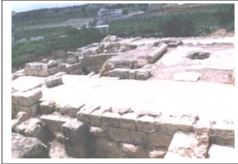
الصورة 2: كنيسة بيت عينون

يعتبر هذا التجمع ريفاً وذلك حسب تصنيف نوع التجمع المعتمد في الجهاز المركزي للإحصاء الفلسطيني. يقع تجمع بيت عينون شمال مدينة الخليل، على خط إحداثي محلي شمالي 107.89 م، وخط إحداثي محلي شرقي 162.20 م، ويرتفع عن سطح البحر 960 م، ويبعد عن مدينة الخليل 5 كم، وتبلغ مساحة المنطقة المبنية فيه 225 دونماً، وتحيط به أراضي سَعيرٍ وحُلُولٍ ومدينة الخليل. يبلغ عدد سكان التجمع حسب تعداد السكان والمساكن والمنشآت - 1997، 1754 فرداً منهم 908 ذكور و846 أنثى، ويبلغ عدد الأسر 227 أسرة. كما يبلغ عدد المباني 296 مبنى وعدد الوحدات السكنية 276 وحدة. ويدير تجمع بيت عينون لجنة مشاريع تم تكليفها عن طريق التعيين من قبل وزارة الحكم المحلي، وتتكون من 3 أعضاء جميعهم ذكور. ولا يتوفر مقر للجنة. أما أهم الحاجات التطويرية للسلطة المحلية فهي تأهيل وتدريب الكادر. ويوجد في تجمع بيت عينون موقعان أثريان، غير مؤهلين للسياحة ولا يرتادهما السياح، وهما خربة بيت عينون وخربة أبو الريش.