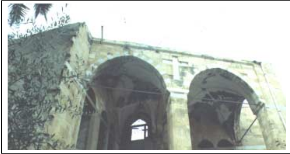
الصورة 2: البلدة القديمة في مدينة غزة

الإنشاءات و يبلغ عددها 131 منشأة و يعمل فيها 1196 عاملاً، النقل و التخزين و الاتصالات و يبلغ عددها 118 منشأة و يعمل فيها 563 عاملاً، الوساطة المالية و يبلغ عددها 85 منشأة و يعمل فيها 641 عاملاً، الأنشطة العقارية و الايجارية و يبلغ عددها 390 منشأة و يعمل فيها 1161 عاملاً. كما يوجد فيها 178 مزرعة للحيوانات و الطيور.