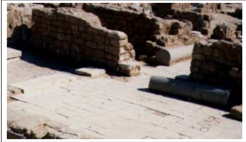
الصورة 4: تل أم عامر في مخيم النصيرات

يقع مُخَيِّمُ النُّصَيْرَاتِ جنوب غرب مدينة غزّة، على خط إحداثي محلي شمالي 95.70 م، وخط إحداثي محلي شرقي 92.50 م، ويرتفع عن سطح البحر 30 م، ويبعد عن مدينة دِيرِ البَلْح 2.5 كم، وتبلغ مساحته الكلية 10938 دونماً، ومساحة المنطقة المبنية فيه 2900 دونم، وتحيط به أراضي المُغْرَاقَه (ابو مِدَّين) ومُخَيِّمُ البُرَيْجِ والزَوَائِدَة. يبلغ عدد سكان التجمع حسب تعداد السكان والمساكن والمنشآت - 1997، 44722 فرداً منهم 22701 ذكراً و22021 أنثى، ويبلغ عدد الأسر 6558 أسرة. كما يبلغ عدد المباني 5484 مبنى وعدد الوحدات السكنية 6290 وحدة. يدير مُخَيِّمُ النُّصَيْرَاتِ مجلس بلدي تم تكليفه عن طريق التعيين من قبل وزارة الحكم المحلي، يتكون من تسعة أعضاء، جميعهم ذكور. ويتوفر مقر للمجلس البلدي تبلغ مساحته 1000 م 2 . ويعمل في المجلس البلدي 45 موظفاً، و9 موظفات. أما أهم الحاجات التطويرية للسلطة المحلية فهي تأهيل وتدريب الكادر الموجود. ويوجد فيه موقع أثري واحد غير مؤهل للسياحة ولا يرتاده السياح وهو تل أم عامر.