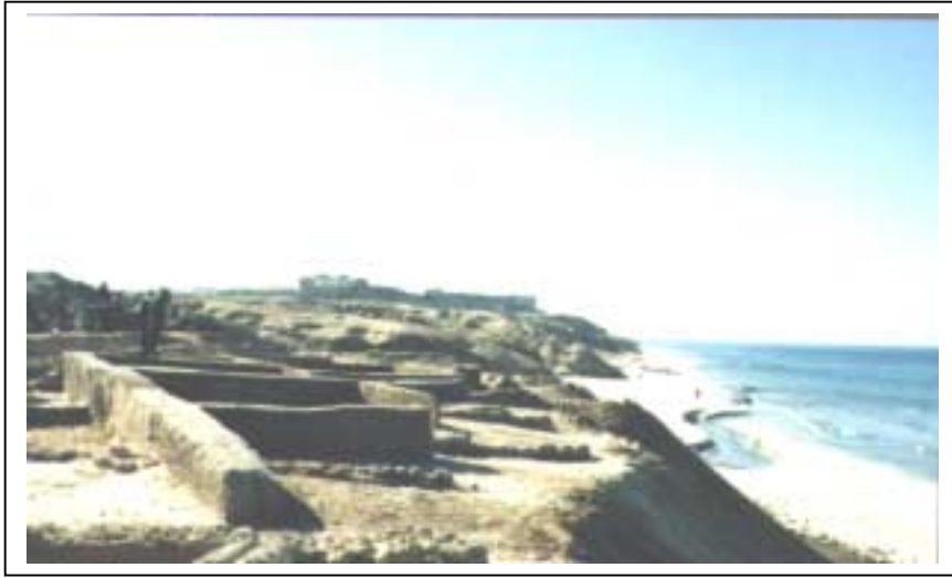
الصورة 1: منطقة البلاخية في مدينة غزة

يعتبر هذا التجمع حضراً وذلك حسب تصنيف نوع التجمع المعتمد في الجهاز المركزي للإحصاء الفلسطيني. تقع مدينة غزة على خط إحداثي محلي شمالي 102.08 م، وخط إحداثي محلي شرقي 98.53 م، وترتفع عن سطح البحر 45 م، وتبلغ مساحتها الكلية 45000 دونم، ومساحة المنطقة المبنية فيها 22788 دونماً، وتحيط بها أراضي بيت حانون وجباليا والمُغراقه (ابو مدين) وجُحر الديك. وتبلغ كمية الأمطار الهاطلة فيها خلال العامين 1997-1998 344.4 ملم، كما يبلغ المعدل العام لحرارة الهواء فيها عام 1998، 21.2 درجة. ويبلغ عدد سكان المدينة حسب تعداد السكان والمساكن والمنشآت - 1997، 291596 فرداً منهم 148517 ذكراً و143079 أنثى، ويبلغ عدد الأسر 41855 أسرة. كما يبلغ عدد المباني 28105 مبانٍ وعدد الوحدات السكنية 46243 وحدة. يدير مدينة غزة مجلس بلدي تم تكليفه عن طريق التعيين من قبل السيد الرئيس، يتكون من 10 أعضاء، جميعهم ذكور. ويتوفر مقر للمجلس البلدي تبلغ مساحته 6481 م 2 . ويعمل في المجلس البلدي 1399 موظفاً، و61 موظفة. أما أهم الحاجات التطويرية للسلطة المحلية فهي تأهيل وتدريب الكادر الموجود. ويوجد في مدينة غزة 5 مواقع أثرية، منها 3 مواقع أثرية غير مؤهلة للسياحة ولا يرتادها السياح، وهي المنطار ومنطقة البلاخية والبلدة القديمة، وهناك موقع صالح للسياحة ويرتاده السياح وهو المسجد العمري الكبير، وموقع آخر صالح للسياحة ولا يرتاده السياح وهو موقع ميماس.