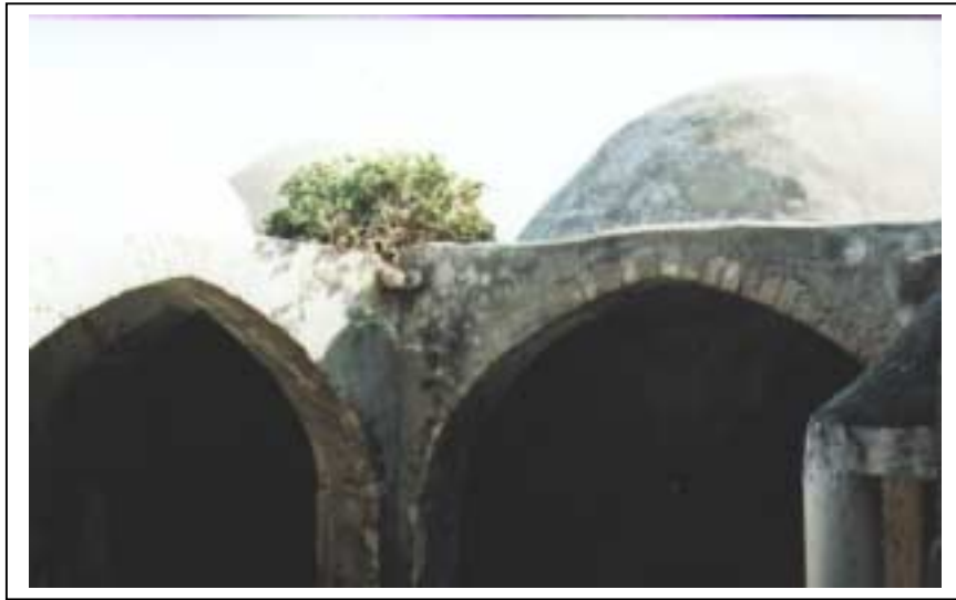
الصورة 5: مقام الخضر في مدينة دير البلح

يعتبر هذا التجمع حضراً وذلك حسب تصنيف نوع التجمع المعتمد في الجهاز المركزي للإحصاء الفلسطيني. تقع مدينة دير البلح على خط إحداثي محلي شمالي 91.80 م، وخط إحداثي محلي شرقي 88.43 م، وترتفع عن سطح البحر 20 م، وتبلغ مساحتها الكلية 14735 دونماً، وتبلغ مساحة المنطقة المبنية فيها 5965 دونماً، وتحيط بها أراضي الزوايدة ووادي السلقا والمصدّر. ويبلغ عدد سكان التجمع حسب تعداد السكان والمساكن والمنشآت - 1997، 34537 فرداً منهم 17377 ذكراً و17160 أنثى، ويبلغ عدد الأسر 4759 أسرة. كما يبلغ عدد المباني 4487 مبنى وعدد الوحدات السكنية 4856 وحدة. ويدير مدينة دير البلح مجلس بلدي تم تكليفه عن طريق التعيين من قبل وزارة الحكم المحلي، ويتكون من 13 عضواً، جميعهم ذكور. ويتوفر مقر للمجلس البلدي تبلغ مساحته 600 م 2 . ويعمل في المجلس البلدي 85 موظفاً، و9 موظفات. أما أهم الحاجات التطويرية للسلطة المحلية فهي تأهيل وتدريب الكادر. ويوجد فيها موقعان أثريان غير مؤهلين للسياحة ويرتادهما السياح، وهما متحف البركة ومقام الخضر.